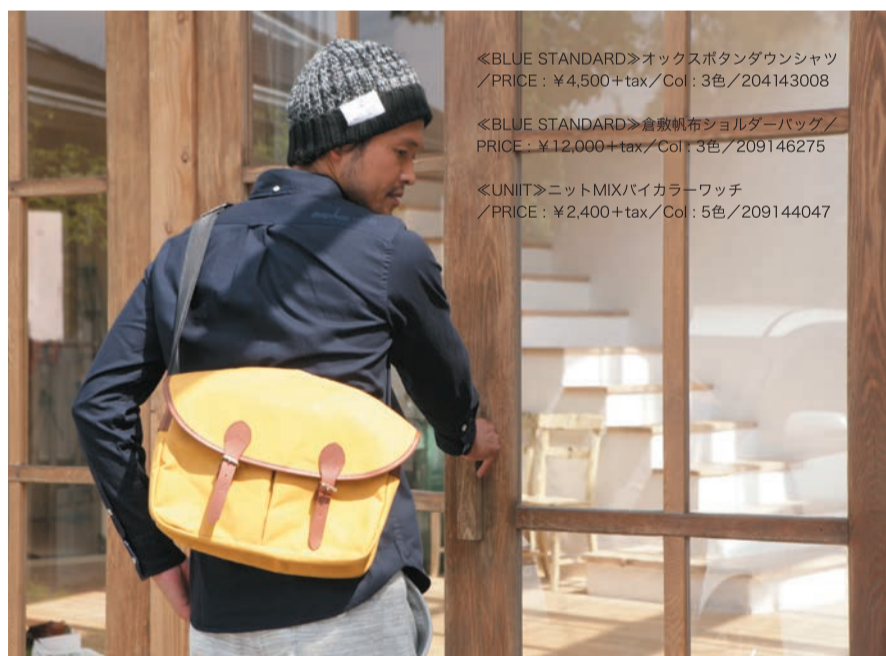
《BLUE STANDARD》オックスボタンダウンシャツ /PRICE : ¥4,500+tax/Col : 3色/204143008