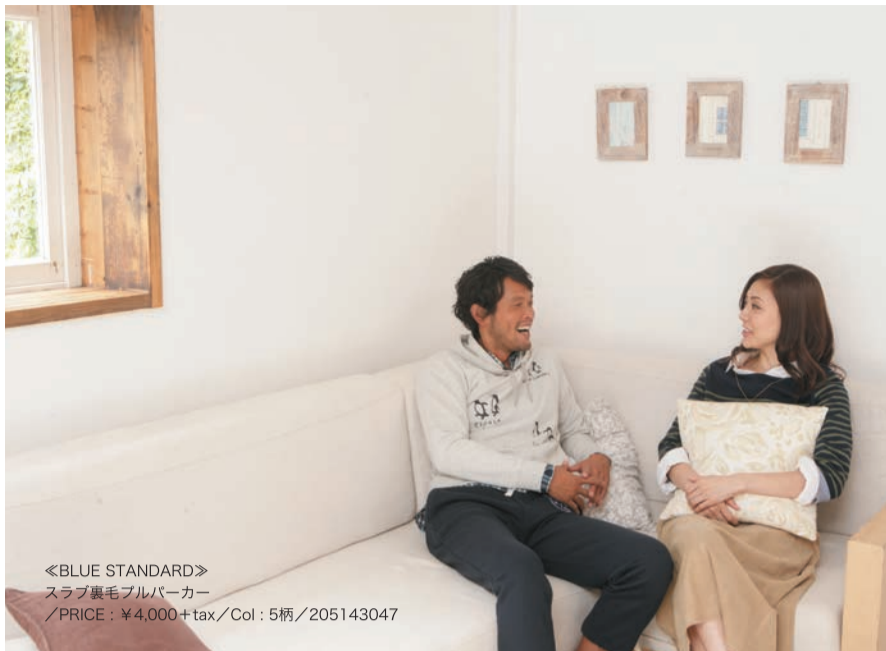
《BLUE STANDARD》 スラブ裏毛プルパーカー /PRICE : ¥4,000+tax/Col : 5柄/205143047