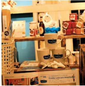
生活雑貨もさわやかで使い心地が良質な商品がズラリ。イチョウのランドリーグッズの品揃えは店内随一！

“comfort blue”は“comfortable”「快適な」という言葉から生まれました。「楽な」「安心な」「元気づける」という意味の“comfort”と「落ち着き」「クリーンな」「清潔感」などを連想させるカラーの「blue」。居心地の良い空間を提供するため、テイストは絞り込まず、「お気に入り」を集めた“comfort blue”を体感してほしい。