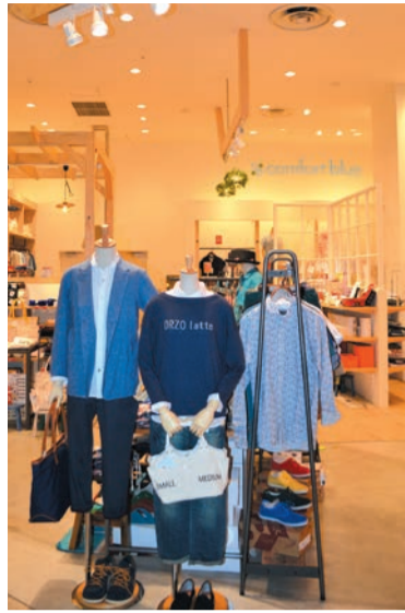
広い入り口で入りやすい雰囲気、旬のコーディネートも押さえています。