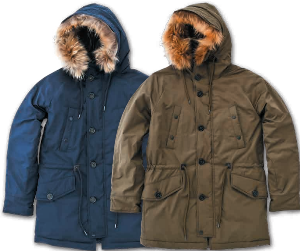
N-3Bタイプのダウンコート。 フレンチダックダウンとリアルファーを使用。